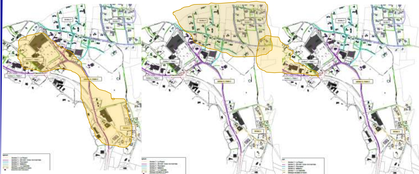
Tranche optionnelle 2

Nota: les contours des tranches sont approximatifs pour indication générale seulement