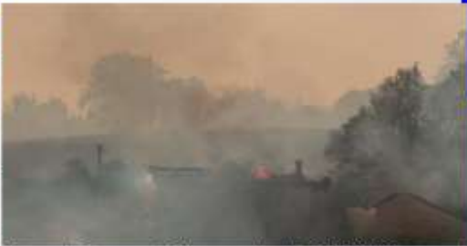
Feux de Ournes et Clayrou . Lundi 12/09/2022